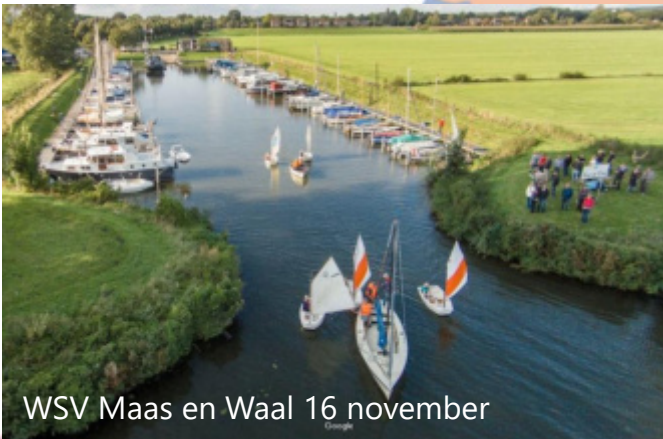
WSV Maas en Waal 16 november